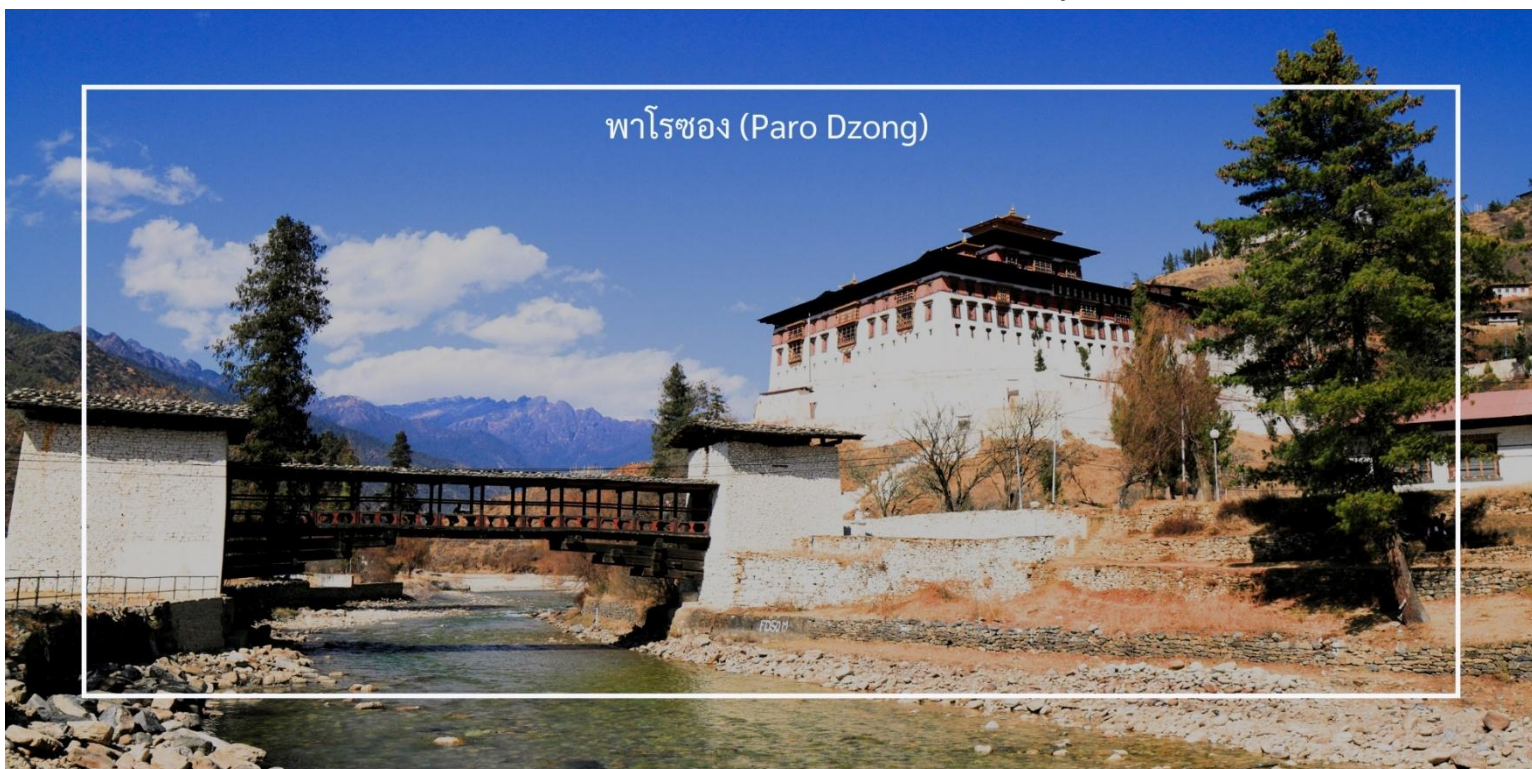
พาโรซอง (Paro Dzong)

เที่ยวชม พาโรซอง (Paro Dzong) เป็นหนึ่งในสถาปัตยกรรมที่สำคัญและสวยงามที่สุดในภูฏาน ตั้งอยู่ในเมืองพาโร (Paro) และมีบทบาทสำคัญทั้งในด้านศาสนาและการปกครอง สร้างขึ้นในปี 1646 เพื่อใช้เป็นที่ทำการของรัฐบาลและวัดประจำเมือง พาโรซองเป็นสัญลักษณ์ของความเข้มแข็งและความเป็นอิสระของภูฏาน