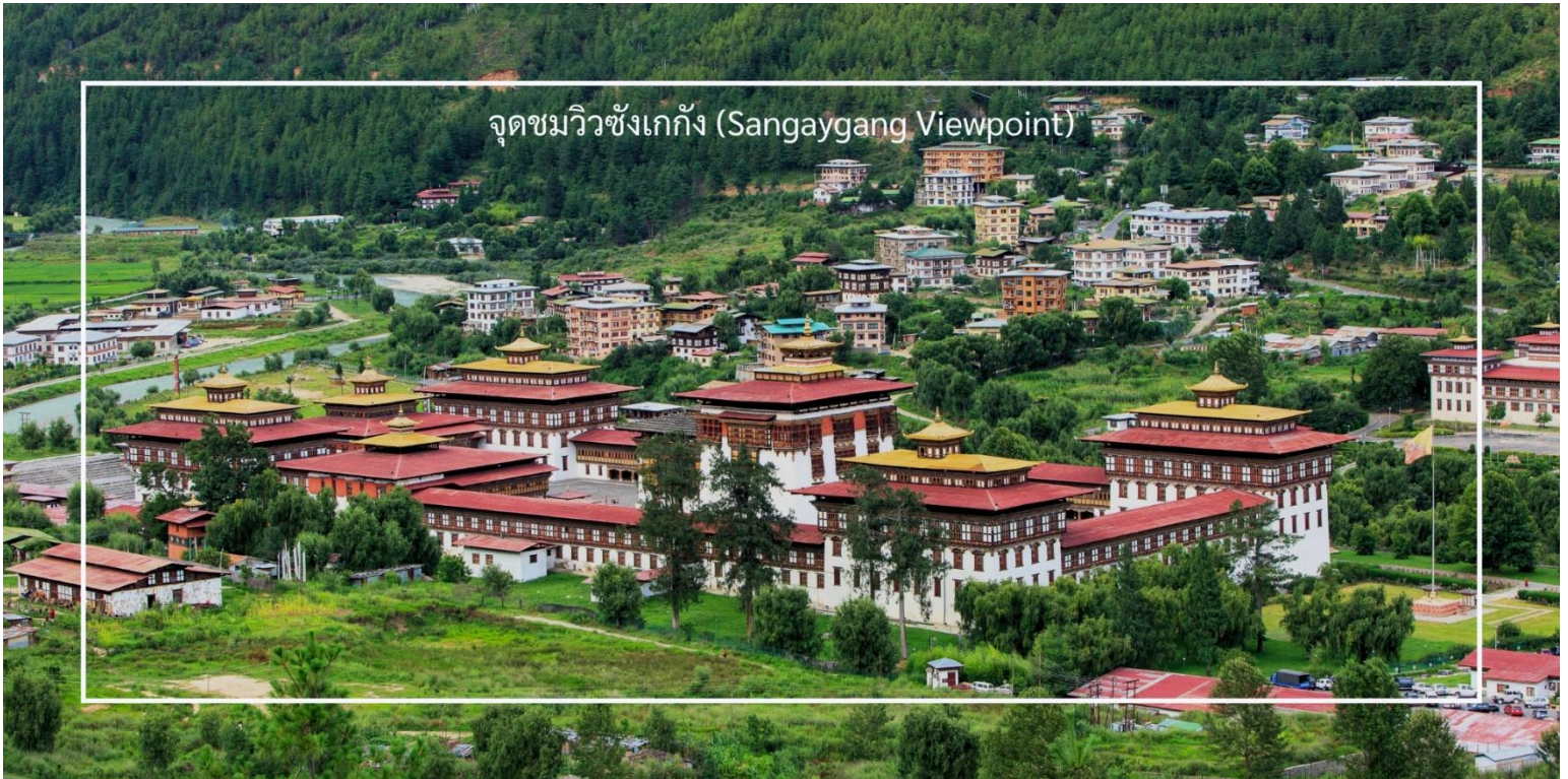
จุดชมวิวซังแก๊ง (Sangaygang Viewpoint)

เที่ยวชม จุดชมวิวซังแก๊ง (Sangaygang Viewpoint) เป็นหนึ่งในจุดชมวิวที่สวยงามในเมืองทิมพู (Thimphu) ตั้งอยู่บนเนินเขาที่สูง ทำให้ผู้เข้าชมสามารถมองเห็นทิวทัศน์ที่งดงามของเมืองทิมพูและภูเขารอบๆ จุดชมวิวนี้นี้มีทิวทัศน์ที่สวยงามของเมืองทิมพูและเทือกเขาหิมาลัย โดยเฉพาะในวันที่อากาศแจ่มใส นักท่องเที่ยวสามารถเห็นวิวที่กว้างไกลได้อย่างชัดเจน