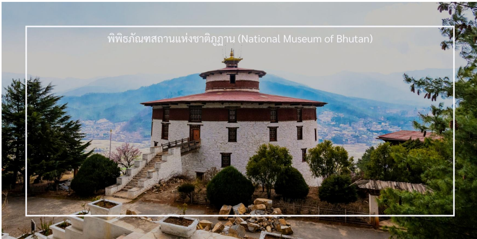
พิพิธภัณฑ์สถานแห่งชาติภูฏาน (National Museum of Bhutan)

เที่ยวชม พาโรซอง (Paro Dzong) เป็นหนึ่งในสถาปัตยกรรมที่สำคัญและสวยงามที่สุดในภูฏาน ตั้งอยู่ในเมืองพาโร (Paro) และมีบทบาทสำคัญทั้งในด้านศาสนาและการปกครอง สร้างขึ้นในปี 1646 เพื่อใช้เป็นที่ทำการของรัฐบาลและวัดประจำเมือง พาโรซองเป็นสัญลักษณ์ของความเข้มแข็งและความเป็นอิสระของภูฏาน