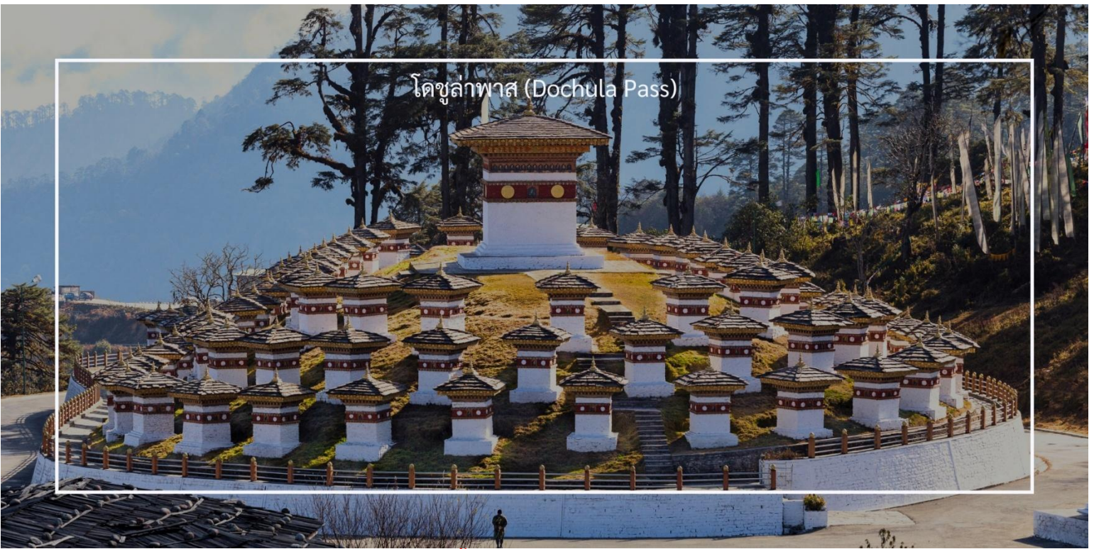
โดชูลาพาส (Dochula Pass)