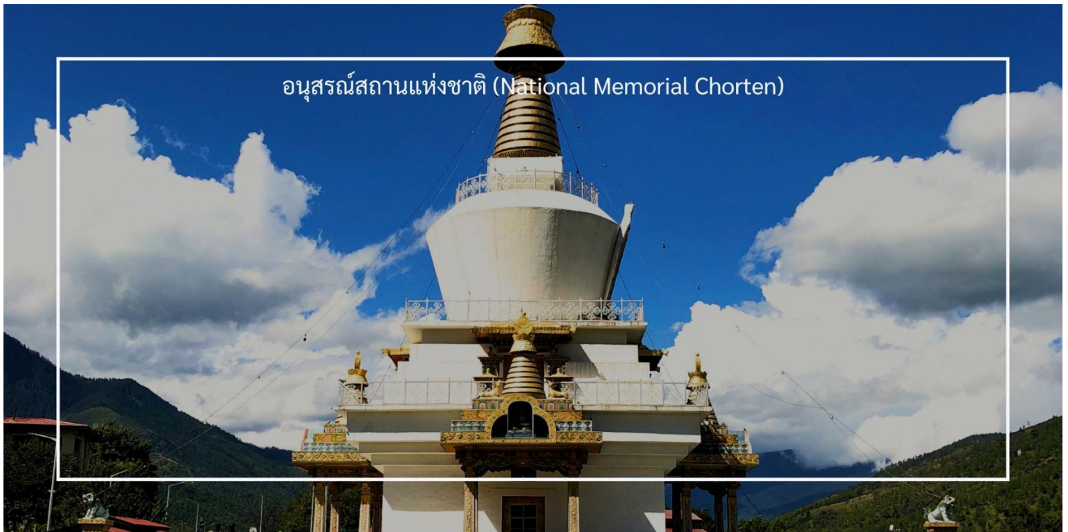
อนุสรณ์สถานแห่งชาติ (National Memorial Chorten)

เที่ยวชม อนุสรณ์สถาน Memorial Chorten หรือที่รู้จักกันในชื่อ Chorten เป็นอนุสรณ์สถานที่สำคัญในเมืองทิมพู (Thimphu) ประเทศภูฏาน สร้างขึ้นเพื่อเป็นเกียรติแก่กษัตริย์ Jigme Dorji Wangchuck ซึ่งเป็นพระมหากษัตริย์องค์ที่สามของภูฏาน มีการออกแบบที่เป็นเอกลักษณ์ในสไตล์ภูฏาน โดยมีโดมกลมใหญ่และลวดลายที่สวยงาม ทำให้เป็นจุดเด่นในทิมพู อนุสรณ์สถานนี้เป็นสถานที่ที่พระสงฆ์และประชาชนมานั่งทำสมาธิและสวดมนต์ โดยมีการหมุน กรงล้อมนตรา (prayer wheel) รอบๆ เพื่อทำให้เกิดความสงบและเสริมสร้างพลังทางจิตใจ สร้างขึ้นในปี 1974 เพื่อเป็นอนุสรณ์แก่กษัตริย์ ผู้ซึ่งมีบทบาทสำคัญในการพัฒนาประเทศและการสร้างสันติภาพในภูฏาน ตั้งอยู่ใกล้กับใจกลางเมืองทิมพู ทำให้สามารถเข้าถึงได้ง่ายและสะดวกสำหรับนักท่องเที่ยว