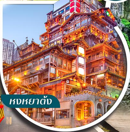
หงหยาดั่ง