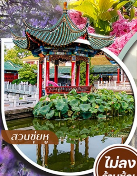
สวนชู่ยู่