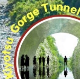
Kiyotsu Gorge Tunnel