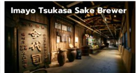
Imayo Tsukasa Sake Brewer