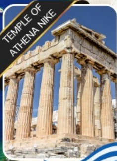
TEMPLE OF ATHENA NIKE