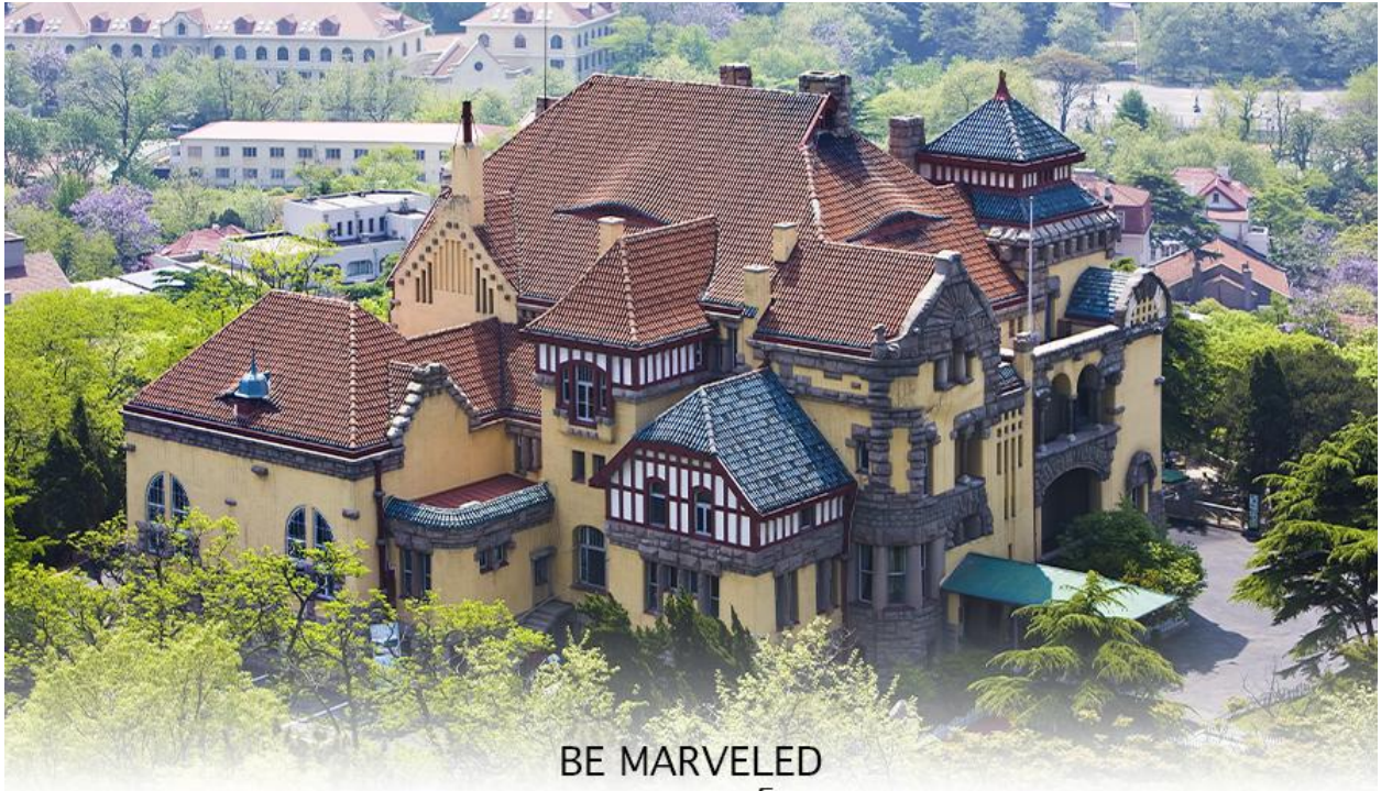
BE MARVELED พระตำหนักกรงจุฬาลงกรณ์