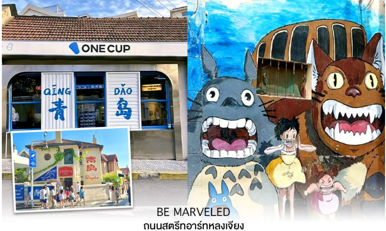
BE MARVELED ถนนสตรีอาร์กหลงเจียง

จากนั้นนำท่านไปชม ทุ่งดอกฟิงค์มอส เป็นสวนดอกไม้ขนาดใหญ่ ในช่วงฤดูใบไม้ผลิทุ่งหญ้าจะปกคลุมไปด้วยดอกฟิงค์มอส ลักษณะของดอกฟิงค์มอสคล้ายดอกซากุระแต่บานบนพื้นดิน ออกดอกหนาแน่นสีชมพู ขาว และม่วง เป็นดอกไม้พุ่มเตี้ย ดอกขนาดเล็ก จะบานสะพรั่งเป็นพรมดอกไม้ เหมาะสำหรับการเดินเล่น ชมดอกไม้ ถ่ายรูป