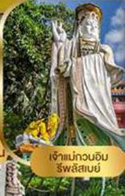
เจ้าแม่กวนอิม ริฟลิสสมัย