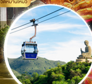
กระเช้านองปิง 360