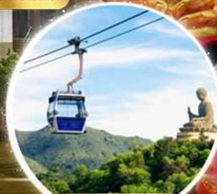
กระเช้าองปิง 360