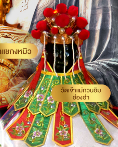
วัดเจ้าแม่กวนอิม ฮองฮ่า