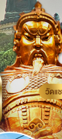
วัดแชงหมิง