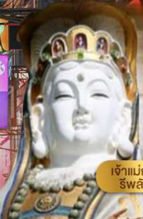
เจ้าแม่กวนอิม ริฟลิสเบย์