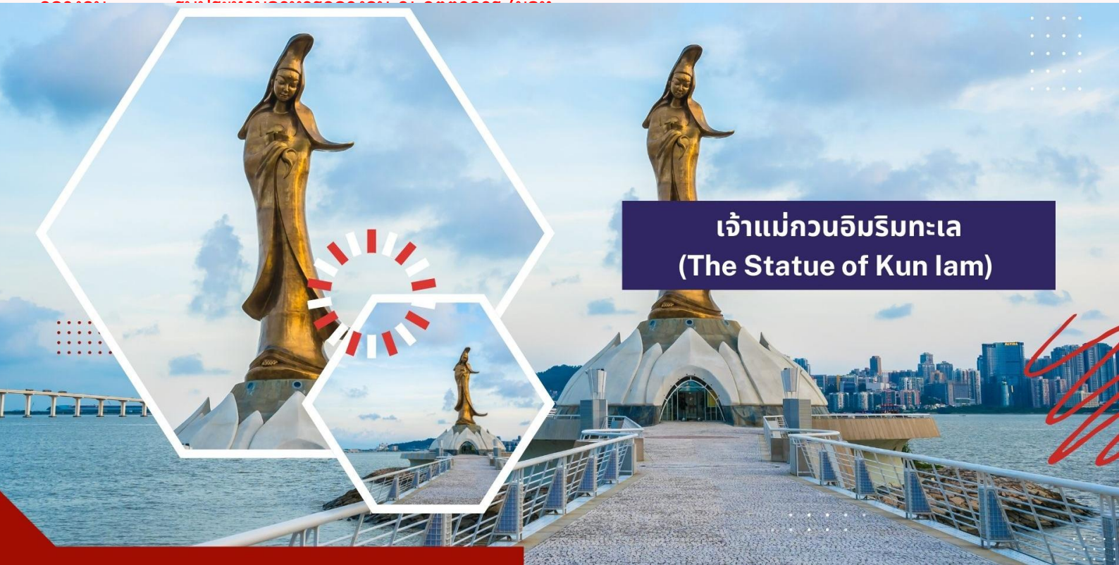
เจ้าแม่กวนอิมริมทะเล (The Statue of Kun Iam)

นำท่านเดินทางสู่ วัดกวนไท (Kuan Tai Temple) หรือรู้จักกันในชื่อ วัดซ่าไถกวยคุน (Sam Kai Vui Kun Temple) เป็นวัดที่มีความสำคัญทางประวัติศาสตร์และวัฒนธรรมในมาเก๊า ได้รับการขึ้นทะเบียนเป็นมรดกโลกของ UNESCO ร่วมกับศูนย์กลางประวัติศาสตร์มาเก๊าในปี ค.ศ. 2005 เนื่องจากคุณค่าทางประวัติศาสตร์ สถาปัตยกรรม และวัฒนธรรมที่โดดเด่น ตั้งอยู่ใจกลางจัตุรัสเซนาโต้และรายล้อมไปด้วยอาคารสไตล์ยุโรป วัดนี้สร้างขึ้นเมื่อปี ค.ศ. 1750 และเป็นที่ประดิษฐานของเทพเจ้ากวนอู ซึ่งเป็นเทพเจ้าแห่งความมั่งคั่งและปกป้องคุ้มครอง วัดแห่งนี้มีเป็นที่นิยมของผู้ทำธุรกิจ ตำรวจ และนักการเมือง เพราะเชื่อว่าสามารถปกป้องสิ่งชั่วร้ายต่างๆ และช่วยเสริมอำนาจบารมีในการปกครองและคุ้มครองบริวาร