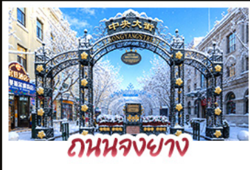
ถนนจงชาง