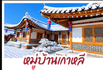
หมู่บ้านเกาหลี