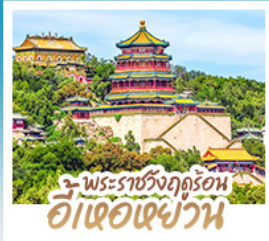
พระราชวังฤดูร้อน ฮ้อเจ้อเป่ย์วาน

ทริปเดียวเที่ยว 2 เมือง ปักกิ่ง-ต้าเหลียน • เทียนจินฟิลาฮาร์โมนี ณ เมืองเวนิสแห่งต้าเหลียน • สัมผัสประสบการณ์ขึ้นกำแพงเมืองจีน ด่านจวิ๊ยกกวน • ช้อปปิ้ง ซิม ซิล ที่ถนนโบราณตงกวนและย่านซานหลี่ถู่