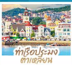
ท่าเรือประมง ต้าเหลียน