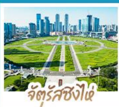
จัตุรัสชิงไฉ่