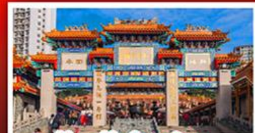
วัดเขว้งต้าเซียน