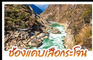
ช่องแคบเสือกระเจิน