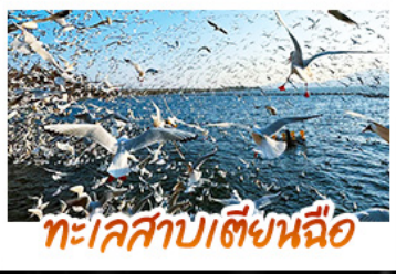
ทะเลสาบเตียนหนือ