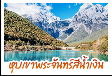
ทะเลสาบพระจันทร์สีน้ำเงิน