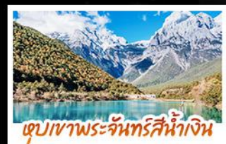
ทะเลสาบพระจันทร์สีน้ำเงิน