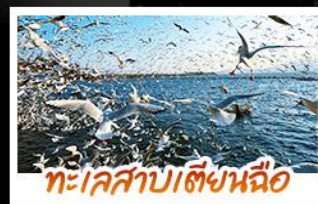
ทะเลสาบเตียนฉือ