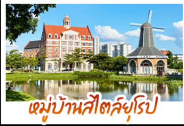
หมู่บ้านสไตล์ยุโรป

ล่องเรือชมดอกไม้สีขาวบานเหนือสายน้ำ ณ เมืองตุ๋นเซียะฮุย หนึ่งในปีหนึ่งครั้ง ถ่ายรูปเช็คอินแบบชิคๆ ณ หมู่บ้านสไตล์ยุโรป • ชม UNSEEN แห่งป่าห่ม ล่องเรือชมทะเลในถ้ำ ณ ซันเหินไห่ เหมือนแดนสวรรค์ • ชมน้ำพุห่านฟ้า ที่ท่องเที่ยวระดับ 4A • ชมความอลังการของ น้ำตกสองแผ่นดิน จีน-เวียดนาม ณ เต๋อเทียน • ถ้ำน้ำแข็งหลงกิงกับประติมากรรมน้ำแข็งสวยงาม และอากาศดีตลอด • ชมดอกไม้ตามฤดูกาล ณ ภูเขาชิง พร้อชมพระเจ้านั่งถนอมพันกษ