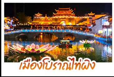
เมืองโบราณที่ผิง