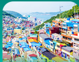
หมู่บ้านดัมเชอน