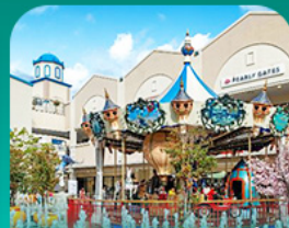
ลือตเต้ เอ้าท์เล็ต