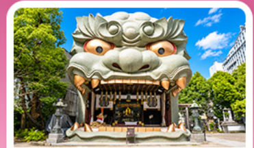
ศาลเจ้านัมบะ ยาชากะ