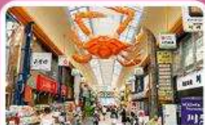
ตลาดคูโรมง

เดินทาง 03 - 07 ก.ค. 69 | 19 - 23 ส.ค. 69 | 25 - 29 ก.ย. 69