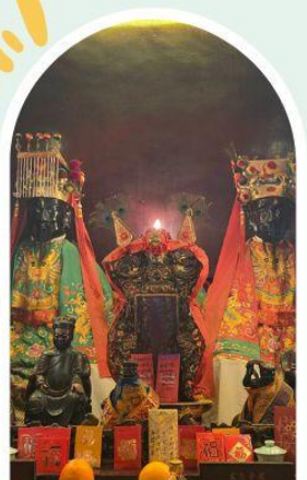
วัดหมิ่นโหมว