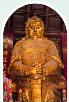
วัดเซกวง

"ไหว้พระ เสริมดวง เพิ่มสิริมงคลแก่ชีวิต"