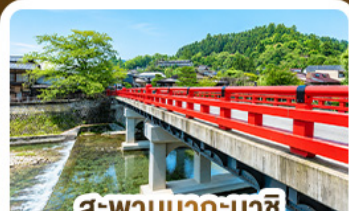
สะพานนากะบาชิ ทาดายาม่า