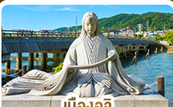
เมืองอูจิ สวรรค์คนรักชาเขียว

คามิโดจิ สวรรค์บนดินแห่งเทือกเขาแอลป์ ชมสะพานคิปปาบาชิ ชมวัดเนียวโดอิน • เมืองทาดายาม่า • ตลาดปลานิชิกิ • ช้อปปิ้งชินโซบาชิ • อีออนมอลล์