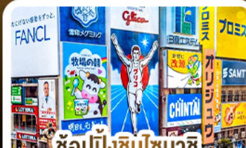
ช้อปปิ้งชินโซบาชิ และโดตงโมริ