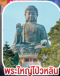
พระใหญ่โป่วหลิน