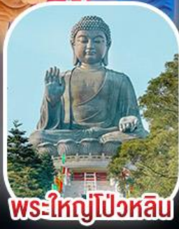
พระใหญ่โป้วหลิน