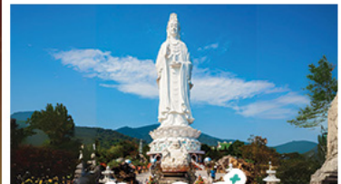
วัดเข็กินอึ้ง