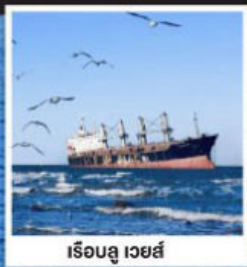
เรือฮู เวย์ส