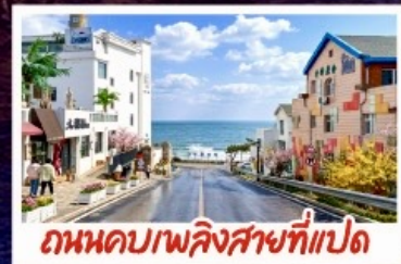
ถนนดบเพลิงสายที่แปด