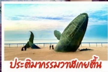
ประติมากรรมวาฬเกยตื้น