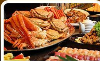
บุฟเฟ่ต์ชาบู+ชาบู 3 ชนิด