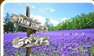
โทมิตะฟาร์ม