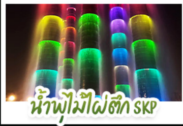
น้ำพุไม้ไผ่ตึก SKP

ภูเขาสี่ดรุณี • อุทยานหวงหลง • เมืองโบราณชงพาน • ทะเลสาบเต๋อซี อุทยานจิวจ้ายโกว • จิตรกรรมฝาผนังหู่ • รูปปั้นหมีแพนด้าเซลฟี ถนนโบราณชอยกว้างชอยแคบ • ถนนคนเดินไท่กู่หฺลี่ • ถนนคนเดินซุนซี แพนด้ายักษ์ปีนตึก ณ ตึก IFS • วัดต้าฉือ • น้ำพุไม้ไผ่ตึก SKP