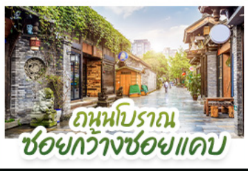
ถนนโบราณ ชอยกว้างชอยแคบ