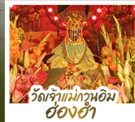
วัดเจ้าแม่กวนอิม ฮ่องฮ่า