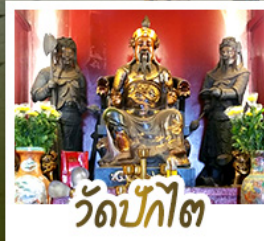
วัดป้กั๊ต