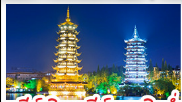
เจดีย์เงินเจดีย์ทองวิวคำ

หมู่บ้านแม่หัวซีเจียง - เขารู้อยี่ - ภูเขาบ่ฝนี่ เมืองบ่เจียง เขางวงซ้าง - เจดีย์เงินเจดีย์ทองวิวคำ - เขารู้อยี่ ซ้อบบิ่งกบถนนคนเดิน ซีเซียง - ซีเจียง แม่บูพิเศษ บูฟ้าพีตซาบูซีฟู้ด ปลาอบเนียร์ เมื่อกคริสตล สุกี้หัด