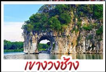
เขางวงซ่าง