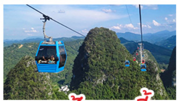
กระเช้าเขาเรอ้อยี่