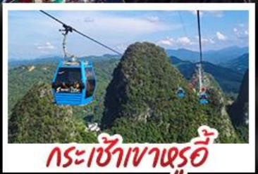
กระเช้าเขาหลูอี้