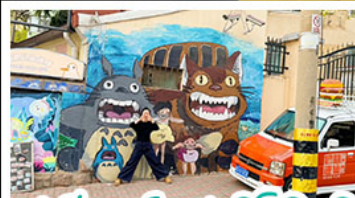
สตรีทอาร์ต สตุตโตอิจิบลิ