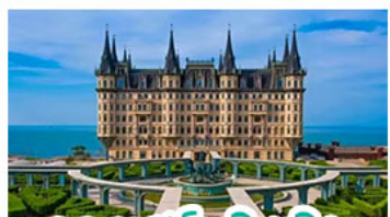
คุกาสัมหลวมเจิ้ง

เมืองเก่าซิงคโปร์ - คุกาสัมหลวมเจิ้ง เบียร์ซิงคโปร์ + อาหารทะเล สตรีทอาร์ต สตุตโตอิจิบลิ