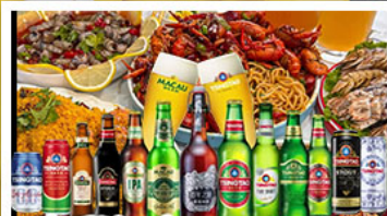
เบียร์ซิงคโปร์ + อาหารทะเล