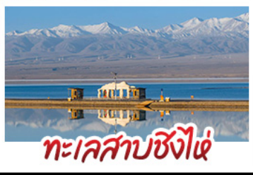
ทะเลสาบซิงไห่