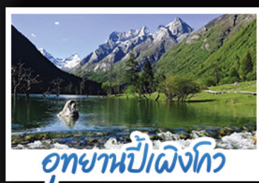
อุทยานปี้เฉิงโกว