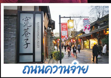
ถนนควานจ้าย