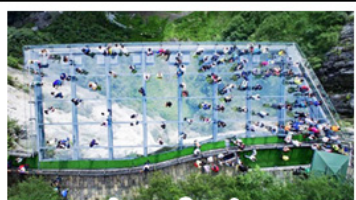
ระเบียงแก้วอุ๋หลง