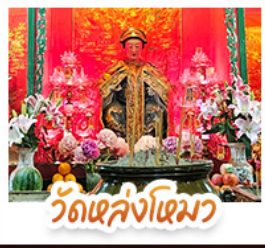
วัดเล่งโงเมว

นั่งรถรางพืดแถมสู่ TOP OF PEAK • ซ้อมบั้งจุใจมกทีก และ CITYGATE OUTLAETS • นั่งกระช้านองปิง สักการะพระใหญ่เทียนถาน • จอพรเจ้าแม่หล่งโหมว แม่ทอง 5 มังกร ให้ประสบความสำเร็จในทุกๆ ด้าน