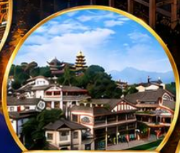
เมืองโบราณเฉิงชิว