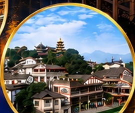
เมืองโบราณฉือชัว