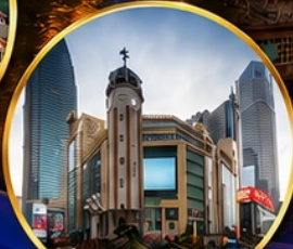
ถนนคนเดินเจี๋ยฟางเป่ย์