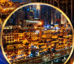
หงหยาดิ่ง