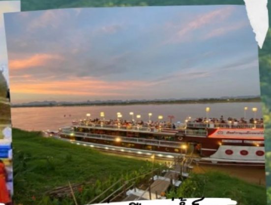
ล่องเรือแม่ฟ้าหลวง