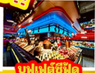
บุฟเฟ่ต์ซีฟู้ด