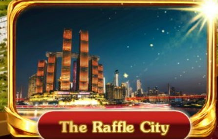
The Raffle City