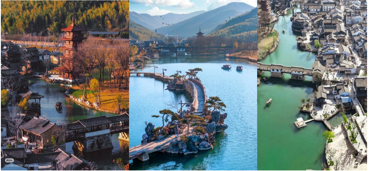
อิสระท่านเที่ยวชมเมือง