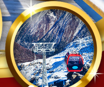
ต้ากู่ปิงชเวน