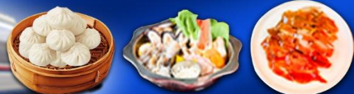
เสี่ยวหลงเปา+เปิดปักกิ่ง+สุกิมองโกล

★★★★ พักรูระดับ 4 ดาว ฟรี!! น้ำหนักกระเป๋า 20 kg.