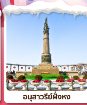
อนุสาวรีย์ผิงหง