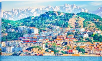
หมู่บ้านชาวประมงซาจื่อไฮ่