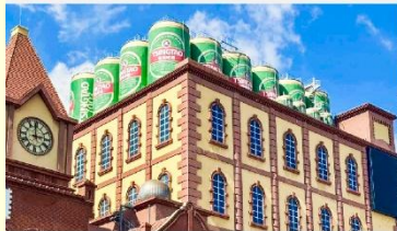
พิพิธภัณฑ์เบียร์ซิงเต่า