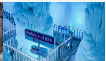
ถ้ำน้ำแข็งอวี่นชีวซาน

*ทางบริษัทฯ ขอสงวนสิทธิ์ในการสลับโปรแกรมทัวร์ตามความเหมาะสมขึ้นอยู่กับสถานการณ์หน้างาน โดยคำนึงถึงผลประโยชน์ของลูกค้าเป็นสำคัญ