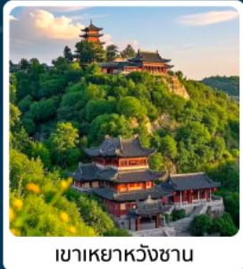
เขาเหย้าหวังซาน