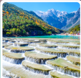
ทะเลสาบโป๋ส่วยเหอ