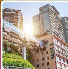
รถไฟทะลุติ๊ก