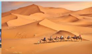
ทะเลทรายเสี่ยงชวาน