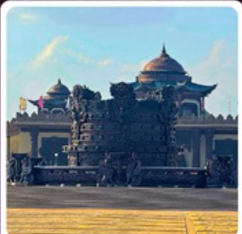
ศูนย์วัฒนธรรมหยวนหยิว