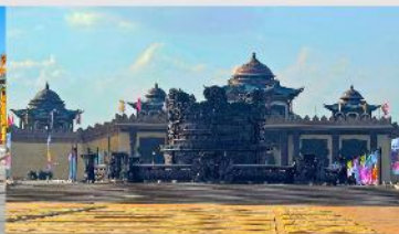
ศูนย์วัฒนธรรมหยวนหยิว