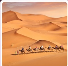
ทะเลทรายเสียนชวาน

• โฮลไก์ เนินทรายเสียนชวาน แหล่งท่องเที่ยวระดับ 5A ภูเขาไฟอูลันฮาตา พิพิธภัณฑท์ภูเขาไฟตามธรรมชาติ