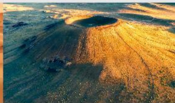
ภูเขาไฟอูลันฮาตา

*ทางบริษัทฯ ขอสงวนสิทธิ์ในการสลับโปรแกรมทัวร์ตามความเหมาะสมขึ้นอยู่กับสถานการณ์หน้างาน โดยคำนึงถึงผลประโยชน์ของลูกค้าเป็นสำคัญ