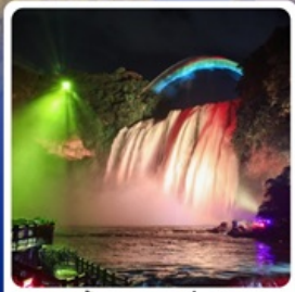
น้ำตกหวงกั๋วซู