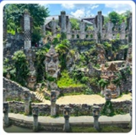
ปราสาทหินเย่หลางกู่