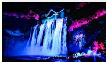
อุทยานน้ำตกหวงกั๋วซู่