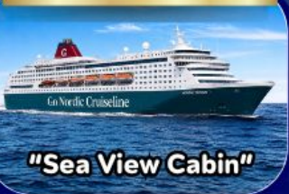
"Sea View Cabin"