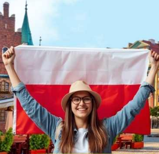
เที่ยวเมืองเกลือ