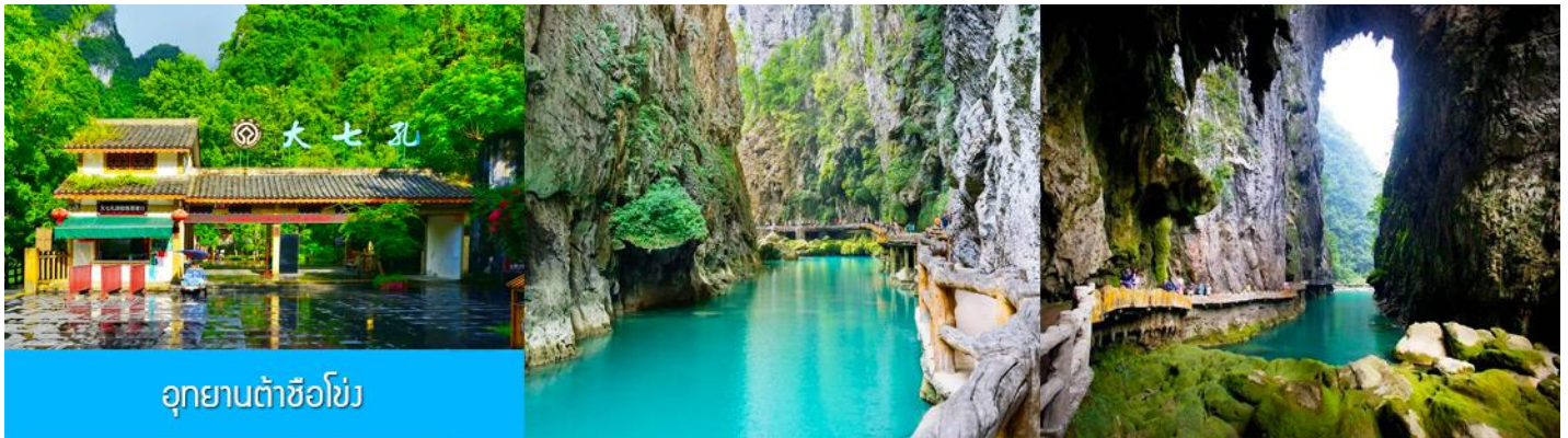
อุทยานต้าซือโข่ง

เช้า รับประทานอาหารเช้า ณ ห้องอาหารของโรงแรม (10)