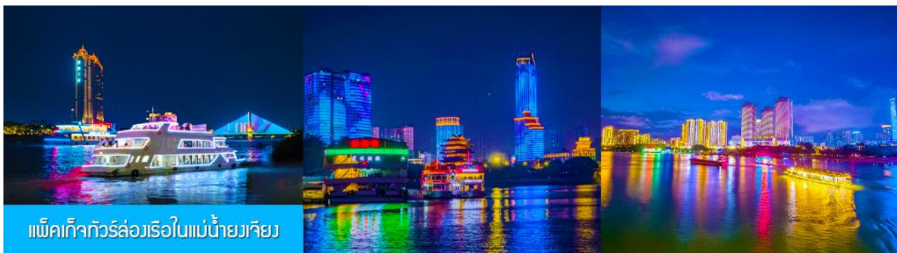
แพ็คเกจทัวร์ล่องเรือในแม่น้ำยงเจียง

คำ อิสระอาหารค่ำ เพื่อความสะดวกและคล่องตัวในการเดินช้อปปิ้ง โดยท่านสามารถลิ้มลองอาหารท้องถิ่นหลากหลายรสชาติได้ตามอัธยาศัย