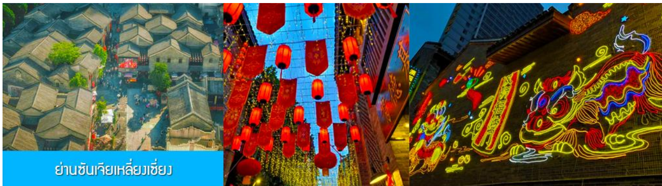
ย่านชุนเจียเหลียงเซียง