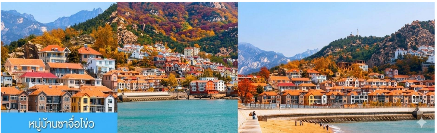
หมู่บ้านชาวโจว