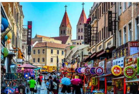
ถนนจงซาน

นำท่านเดินทางชม สะพานจ้านเจียว 栈桥 เป็นแลนด์มาร์คแห่งประวัติศาสตร์คู่เมืองชิงเต่า สร้างเมื่อปี ค.ศ.1891 มีลักษณะเป็นสะพานหินทอดยาวกว่า 440 เมตรสู่ทะเล ปลายสะพานมีศาลา ทรงแปดเหลี่ยมสีแดงที่โดดเด่น ซึ่ง เป็นสัญลักษณ์บนฉลากเบียร์ชิงเต่า ขึ้นชื่อเรื่องวิวสวย รับลมทะเล ให้ท่านเก็บภาพบรรยากาศ