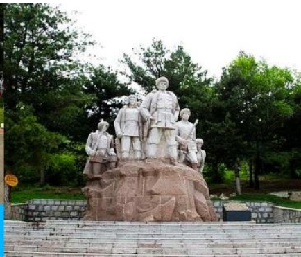
อนุสาวรีย์ฟิงหวง