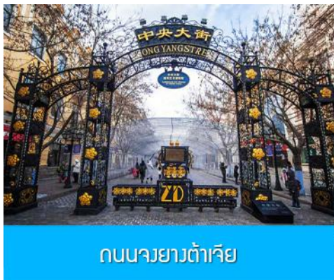
ถนนจงยางต้าเจีย